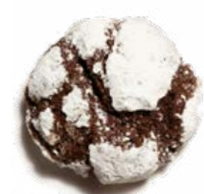
MISS CIOCCOLATISSIMA DISPONIBILE SOLO NEI MESI INVERNALI