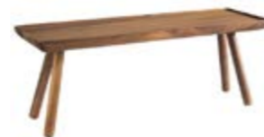
COD 15623 16,2 X 53 X 20 CM