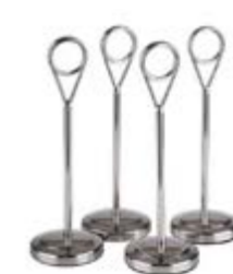
COD 71512 H 10,5 CM