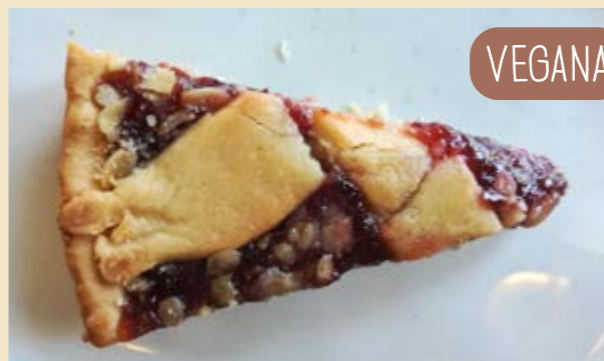
MARMELLATA DI FRAGOLE E CRUMBLE DI LIMONI