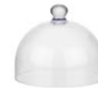
COD 6520 Ø 30 CM H 22 CM