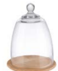
COD 830 Ø 18,5 CM H 24 CM