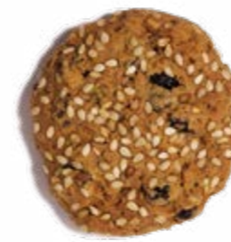
RAGGI DI SOLE