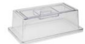
COD 11043 17,6 X 32,5 X 10,5 CM