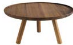
COD 15621 Ø 30,5 CM