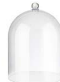
COD 6525 Ø 30 CM H 40 CM