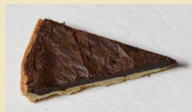
CROSTATA AL CIOCCOLATO CON FARCITURA BROWNIE.