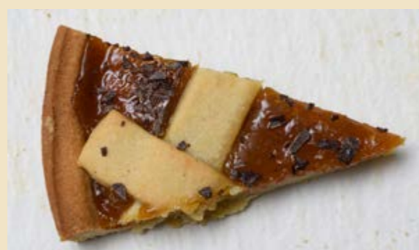
ARANCIA E SCAGLIE DI CIOCCOLATO

LA SELEZIONE È RICCA E GUSTOSA E PREVEDE L'ACCOPIAMENTO DI MARMELLATA E FRUTTA SECCA/CIOCCOLATO.