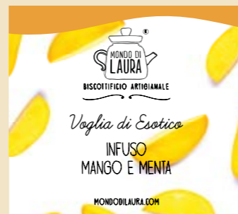
COCCOLA MI È IL BISCOTTO GIUSTO