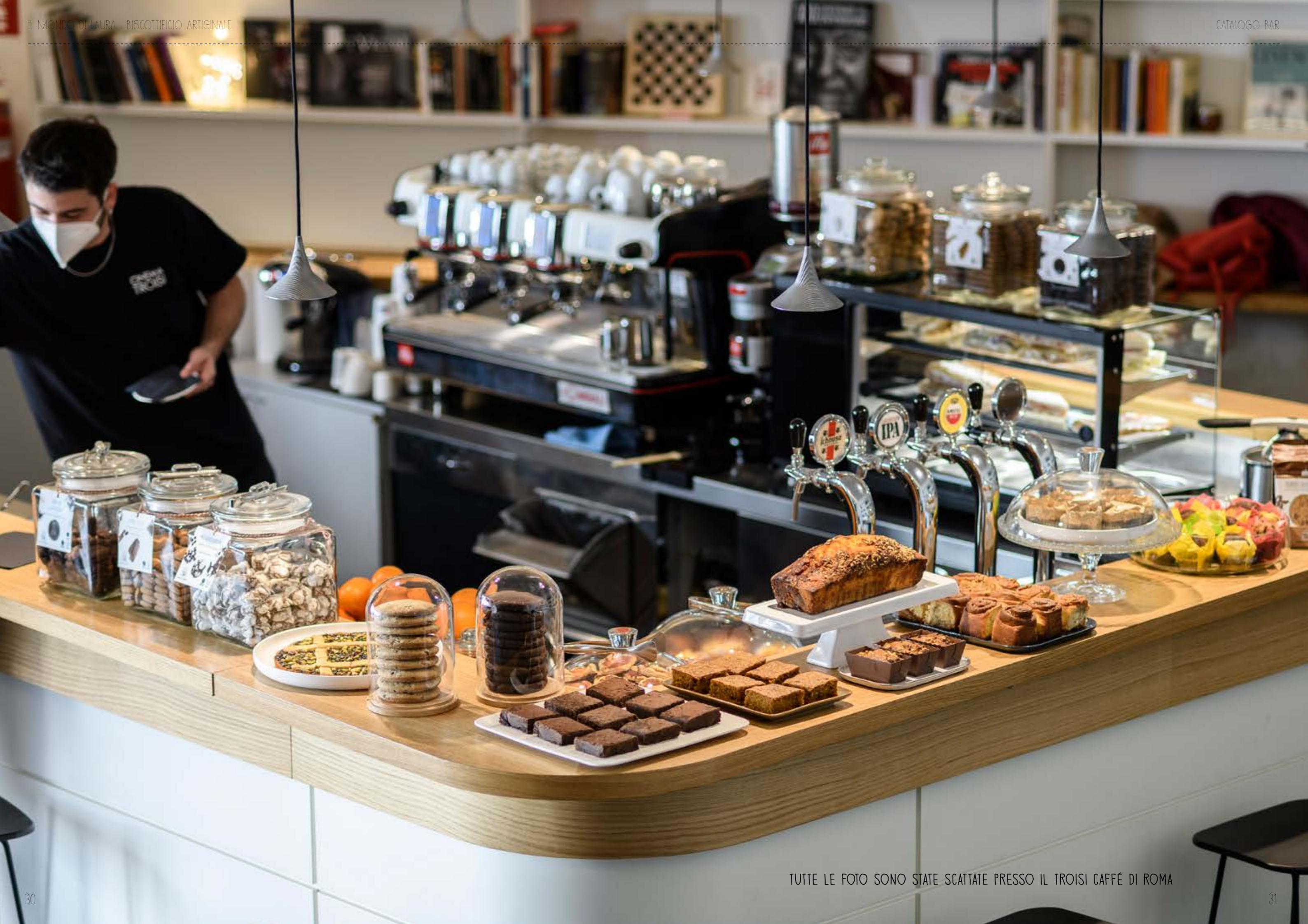
TUTTE LE FOTO SONO STATE SCATTATE PRESSO IL TROISI CAFFÉ DI ROMA