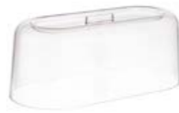
COD 11056 12 X 26 X 11 CM