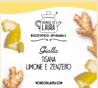
PERFETTO PER LA TORTA DI CAROTE