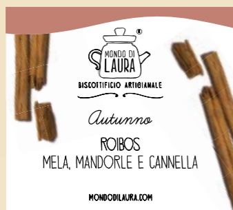
PROVALO CON IL CRUMBLE DI MELE