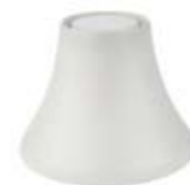
COD 84928 Ø 16,5 CM H 12 CM