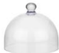
COD 6519 Ø 21 CM - H 17 CM