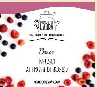
PROVALO CON I TEDDY BERRY