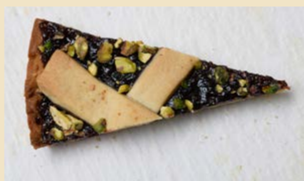
VISCIOLE E PISTACCHI