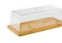
COD 821 16,5 X 32 X 11 CM