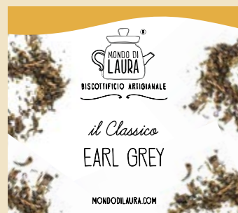
PROVALO CON I CANDY SPICE