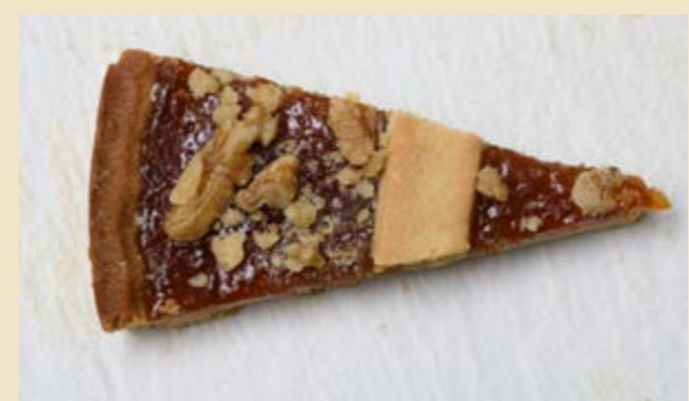
ALBICOCCA E NOCI