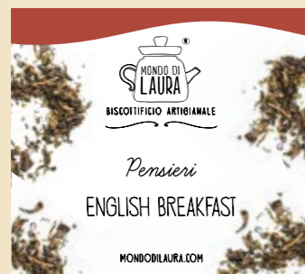
PERFETTO CON I RAGGI DI SOLE