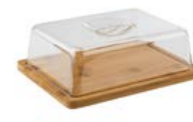
COD 820 18,5 X 24 X 8 CM