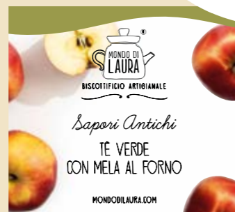
PERFETTO CON LA TORTA DI ROSE