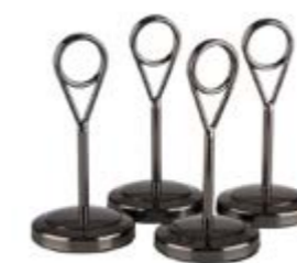
COD 71513 H 15,5 CM