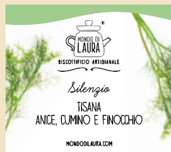
PROVALO CON I GREEN LADY