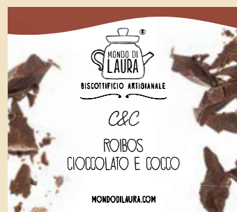
PERFETTO CON I BROWNIES